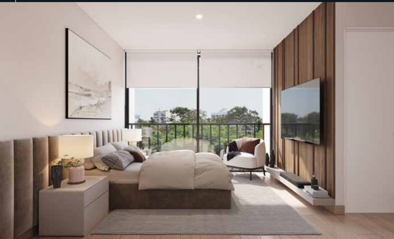
Dormitorio Principal > con Vista a Parque