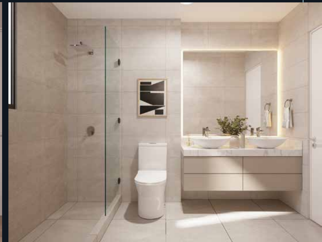
Baño Principal > Inodoros One Piece